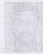
ನಿಂಪುನಿವಾಸಯ್ಯ ಸಹಾಯಕ ಕಾರ್ಯಾಲಯ, ಭಂಕೂರ. ಪಾ: ಚಿತ್ತಾಪೂರ ಜಿ: ಕಲಬುರಗಿ